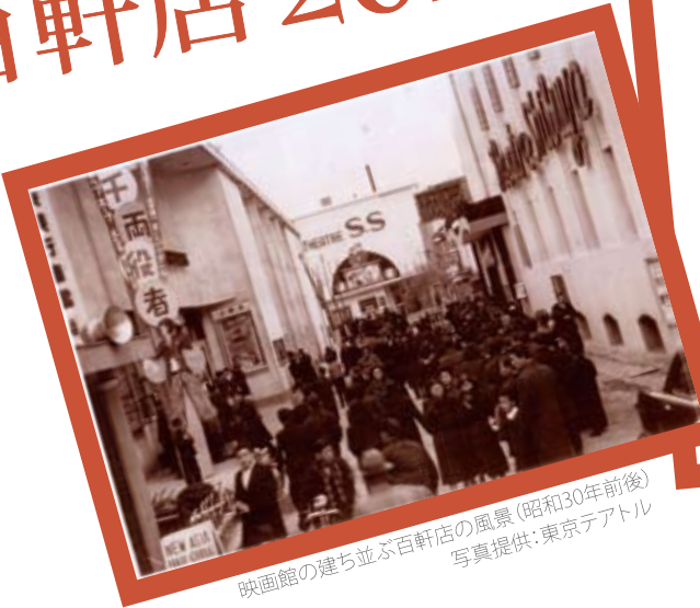
映画館の建ち並ぶ百軒店の風景(昭和30年前後)